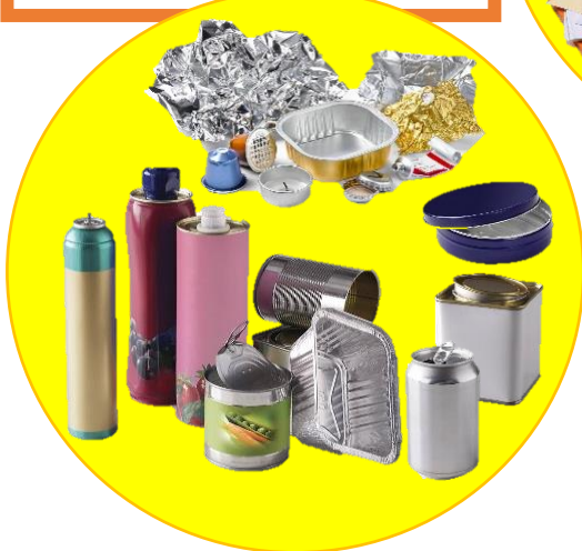
EMBALLAGES EN METAL