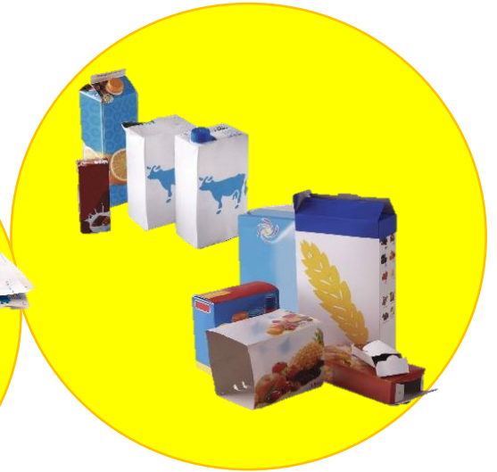
EMBALLAGES ET BRIQUES EN CARTON